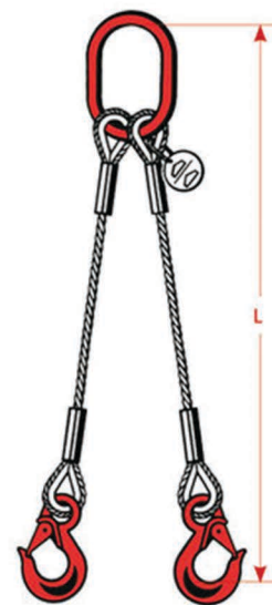
1219. Élingue câble

À 2 brins avec crochets de sécurité à verrouillage automatique.