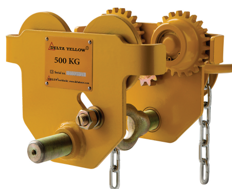
7213 D0. Avance par chaîne