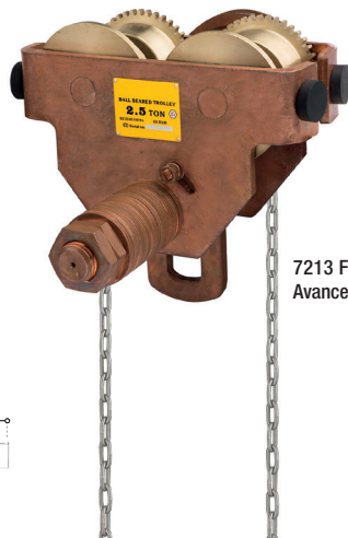
7213 F0. Avance par chaîne