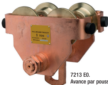
7213 E0. Avance par poussée