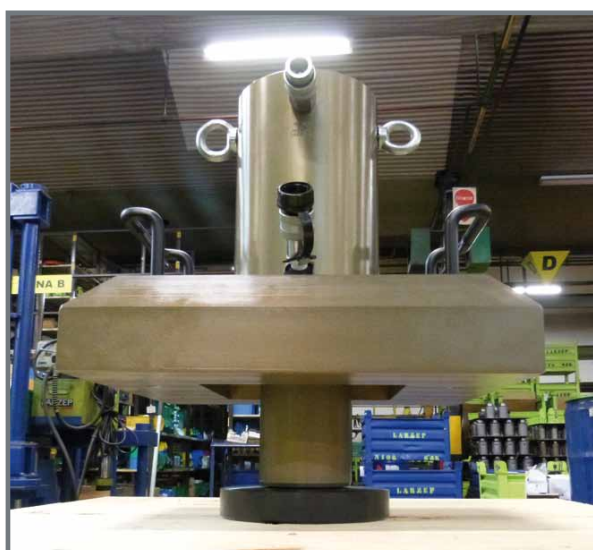
Vérins grimpeurs en aluminium.