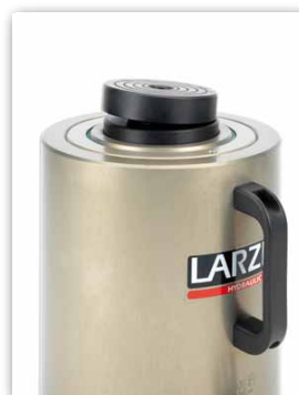
Tête oscillante en option.