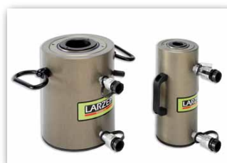
Vérins aluminium double effet, tige creuse DAH.