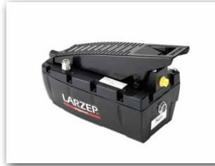
Pompe pneumatique, Z. Page. 82