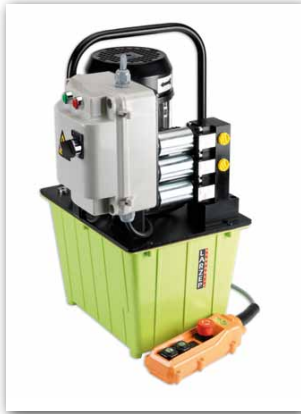
Centrales à moteur. Page. 88