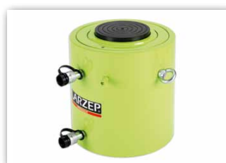
Vérins double effet, fort tonnage, DDR.